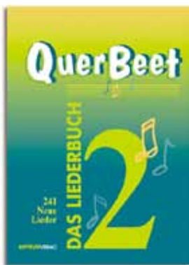
QuerBeet 2: 241 ausgewählte Titel 19,50 €