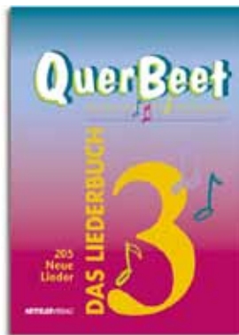
QuerBeet 3: 205 ausgewählte Titel 22,00 €

Einteilung in Rubriken: Rock, Pop & Blues / Golden Oldies / Liedermacher Germany & Austria / Schlager & Chansons / Kinder- & Spaßlieder / Country & Volkslieder / Instrumentals / Musicals / Religiöse Lieder