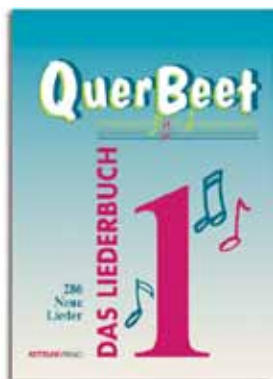
QuerBeet 1: 286 ausgewählte Titel 19,50 €

Mit den besten Hits und Interpreten, die Musikgeschichte geschrieben haben.