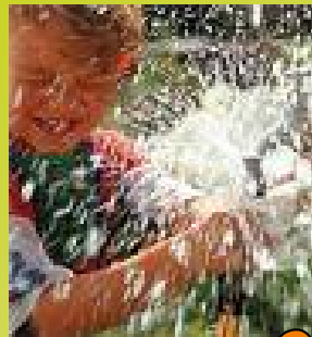
Orientierungstage für Schulklassen