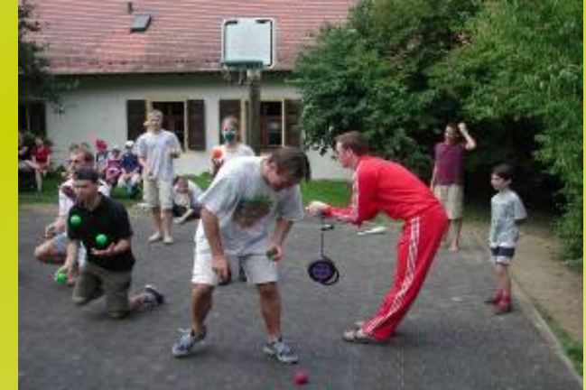
Freizeitorientierte Komplettangebote für Schulklassen