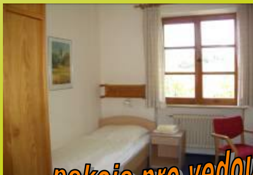
pokoje pro vedoucí